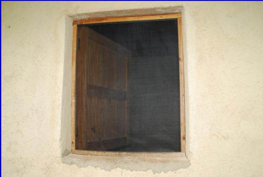
Ventanas con mosquitero