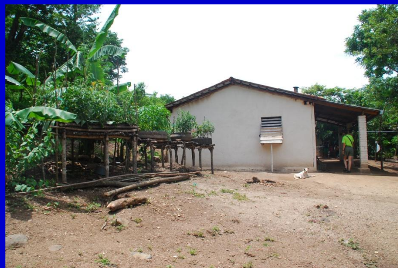
Casa de Magdalena

Se trata de las DOS PRIMERAS CASAS construídas. A partir de sus defectos hemos mejorado posteriores proyectos similares