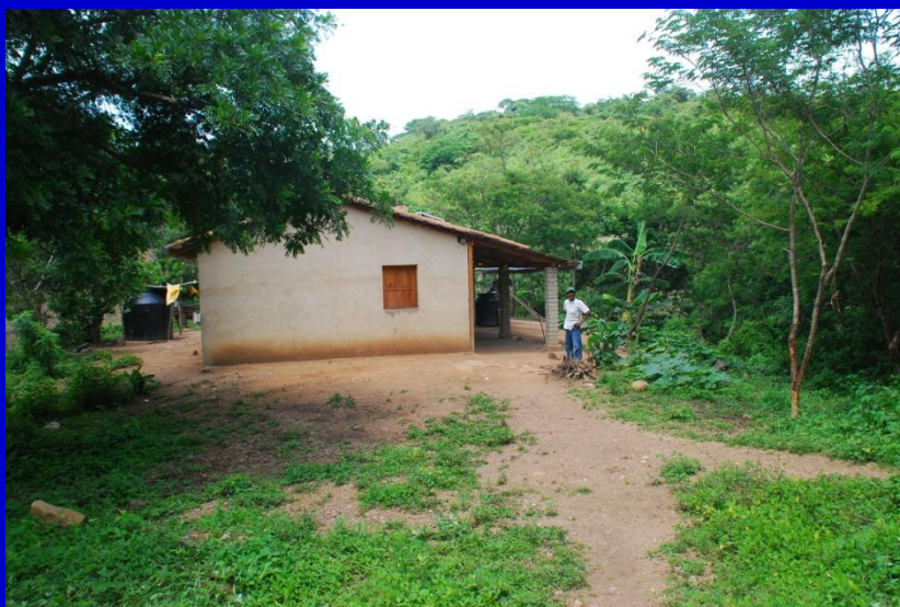
Casa de Antonio