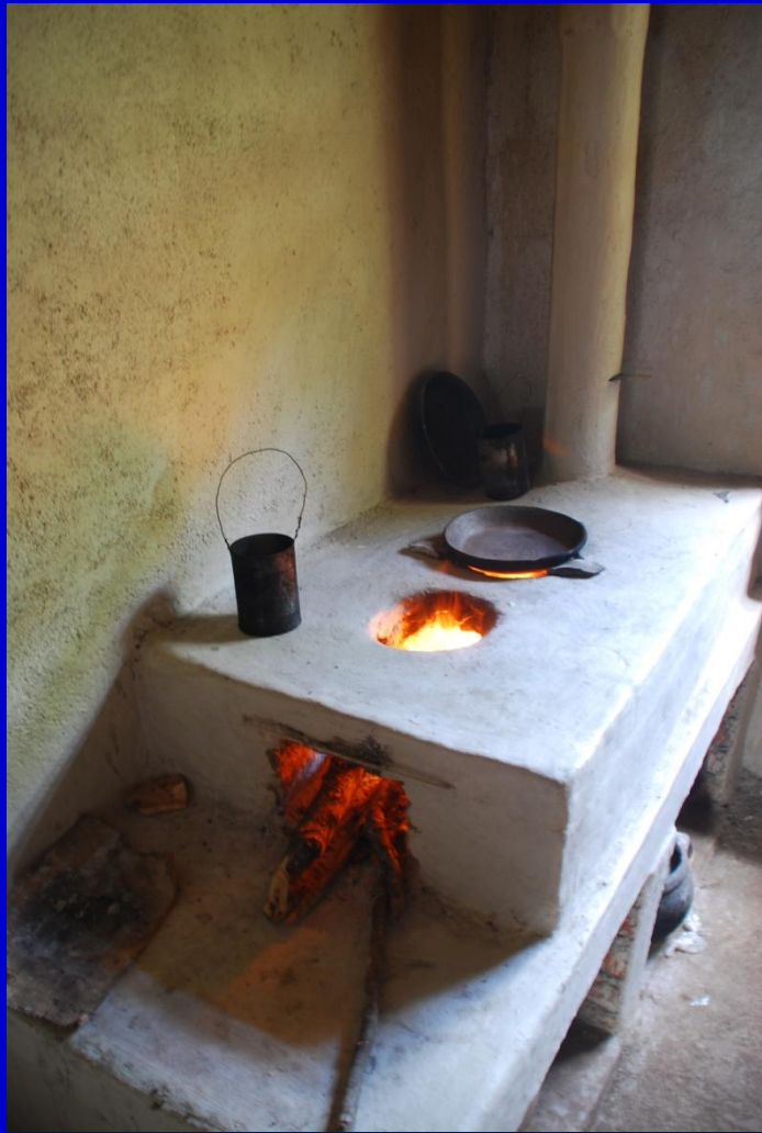
Fuego con chimenea